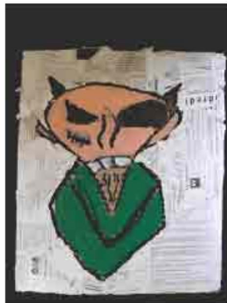
Pourquoi j'aime la classe relais

En bref la classe relais n'est pas une classe de cas sociaux ou autres voyous mais une classe avec des élèves en échec scolaire ce lieu leur donne la volonté de réussir dans cette société.